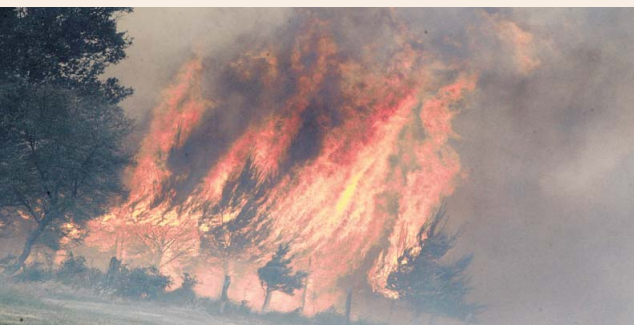
Bomen in brand op de Kalmthoutse Heide.

BRUSSEL (BELGA) | Er is nood aan een federaal draibook om branden in bos- en natuurgebieden te bestrijden. Dat is de voornaamste conclusie van het overleg tussen verschillende betrokken partijen, dat plaatsvond op initiatief van Vlaams minister van Leefmilieu Joke Schauvliege. Momenteel wordt er enkel gewerkt met gemeentelijke en provinciale plannen. Naar aanleiding van de zware branden in Limburgse natuurgebieden en de Kalmthoutse Heide wilde de minister nagaan welke stappen er genomen moeten worden om dergelijke branden in de toekomst beter aan te pakken. Andere prioriteiten zijn het voorzien van meer en beter materiaal. Ook werd het engagement aangegaan om extra te investeren in communicatie.